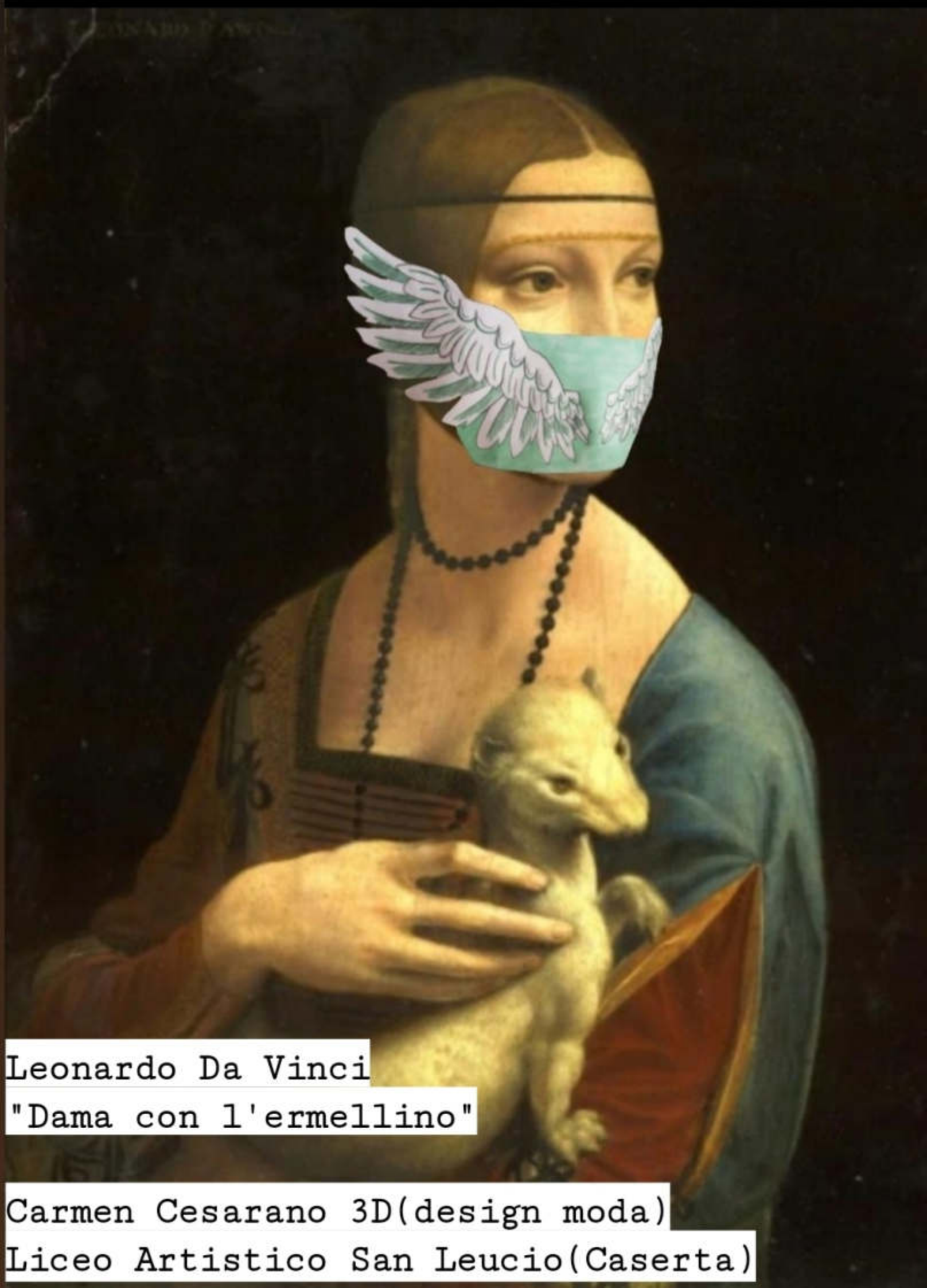
Leonardo Da Vinci "Dama con l'ermellino"